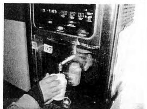
擺設位置:男生宿舍二樓編號:57