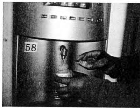
擺設位置:男生宿舍三樓編號:58