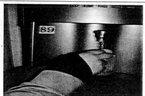
擺設位置:女一舍 AB 棟二樓編號:89