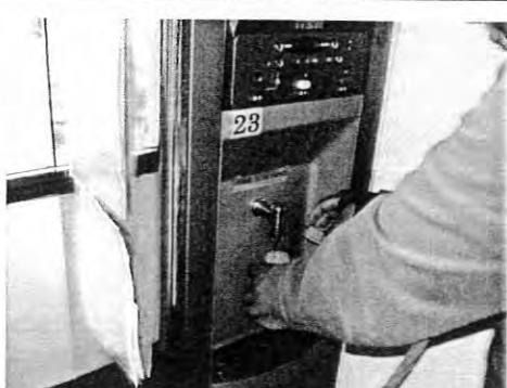
擺設位置:圖書館四樓編號:23