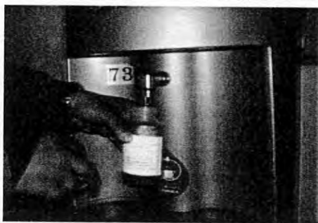
擺設位置:女生宿舍四樓編號:73