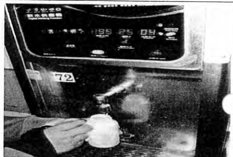
擺設位置:女生宿舍三樓編號:72