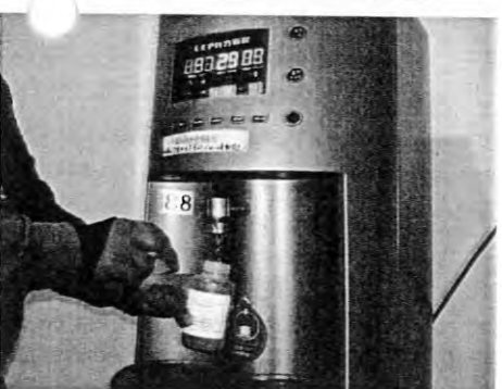
擺設位置:女一舍 AB 棟一樓編號:88