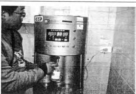
擺設位置:研究大樓四樓編號:49