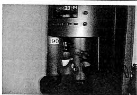
擺設位置:女一舍 AB 棟二樓編號:90