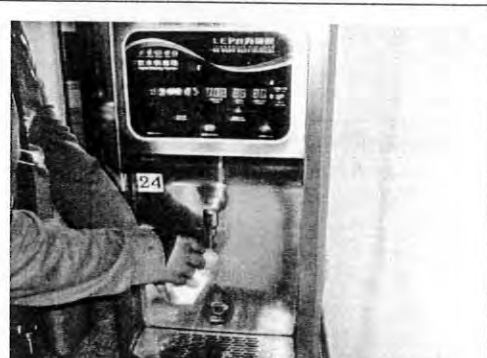
擺設位置:圖書館四樓編號:24