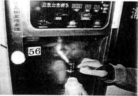
擺設位置:男生宿舍一樓編號:56