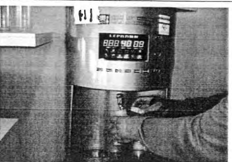
擺設位置:關美館二樓編號:111