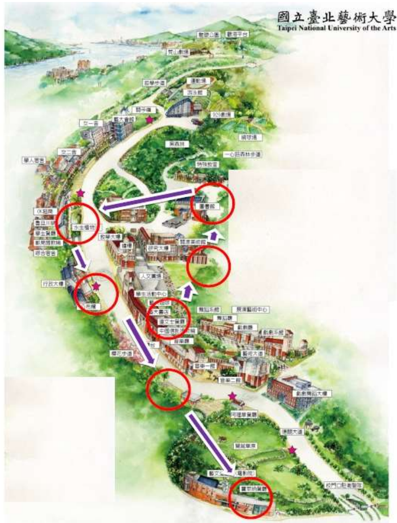
圖一、北藝大校園蛙類資源調查樣點位置及調查路線