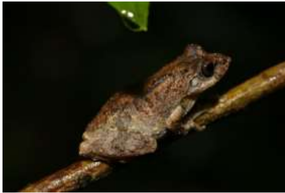
圖 四、拉都希氏赤蛙